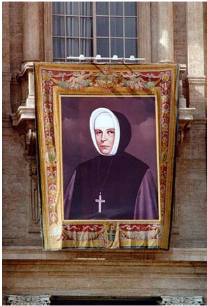
Tableau de la bienheureuse Émilie Gamelin dans la Gloire du Bernin* exposé sur la façade de la Basilique St-Pierre à Rome lors de la cérémonie de sa Béatification.

En ce début d'année 2011, et dans le rayonnement de ces anniversaires, nous formulons des vœux très sincères à tous nos lecteurs, afin que chacun et chacune bénéficie des multiples faveurs que la Providence daignera répandre sur tous ceux qui feront mémoire de cette « grande dame de Montréal » la bienheureuse Émilie Tavernier-Gamelin.