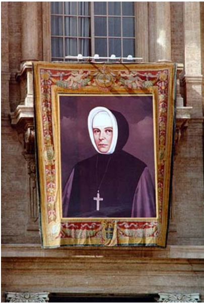
Imagen de la Beata Emilia Gamelin en la Gloria de Bernini* expuesta en la fachada de la Basílica de San Pedro en Roma durante la ceremonia de su Beatificación.

A principios de 2011, y con el resplandor de estos aniversarios, enviamos nuestros sinceros saludos a todos nuestros lectores y lectoras, para que gocen de los muchos favores que la Providencia procura a todos aquellos y aquellas que guardan en su recuerdo a la "Gran Dama de Montreal", la Beata Emilia Tavernier-Gamelin.