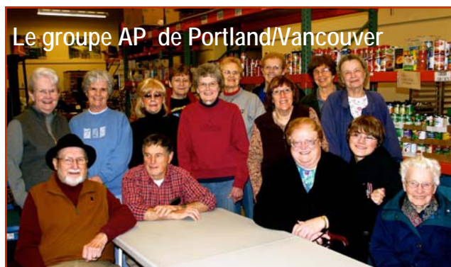
Le groupe AP de Portland/Vancouver

Samedi matin, à l'entrepôt alimentaire St. Vincent de Paul, les Associées et Associés de Portland ont préparé plus de 900 sacs à lunch pour des écoliers affamés. On recueille aussi des pots de beurre d'arachide, de la confiture et des goûters santé pour les écoliers sans foyer de Portland.