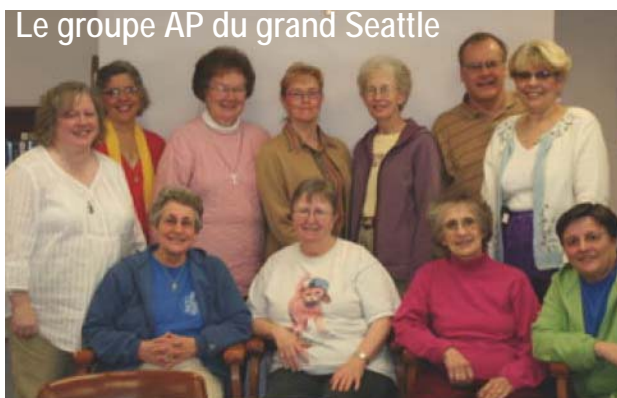
Le groupe AP du grand Seattle